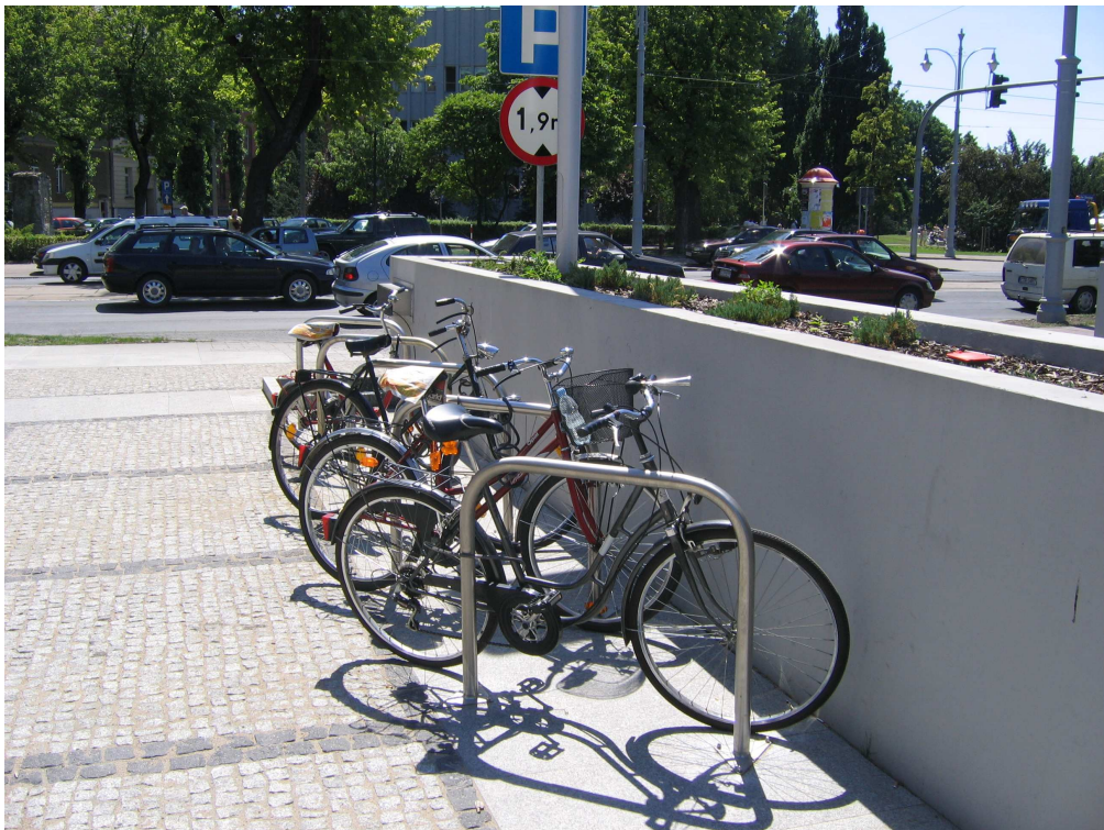
Centrum Sztuki Współczesnej w Toruniu