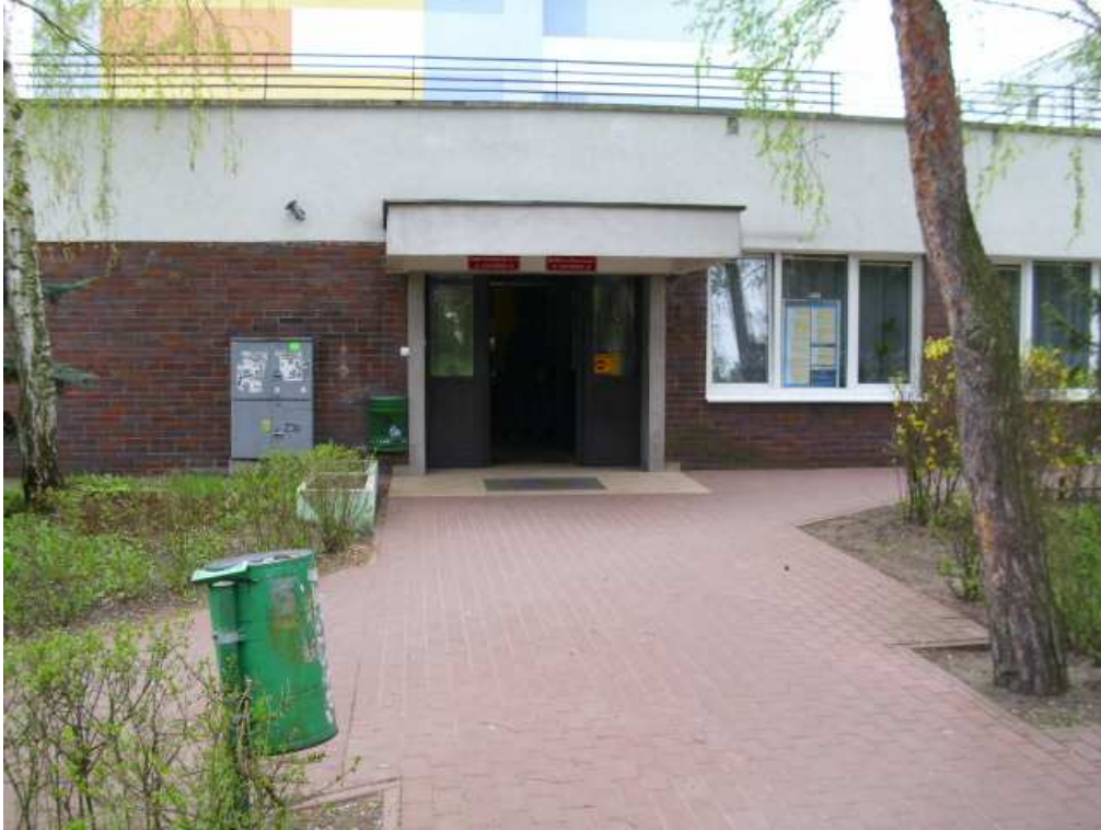
Dom Akademicki nr 9, ul. Gagarina 21 Stan obecny: brak stojaków rowerowych Zalecane: montaż 3 stojaków typu odwrócone U