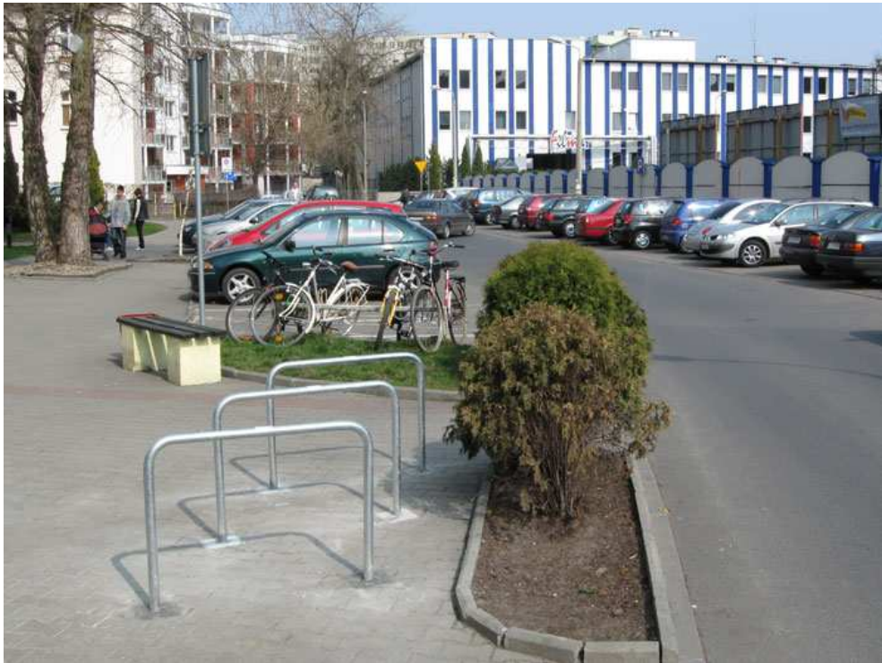
Wyższa Szkoła Bankowa w Toruniu