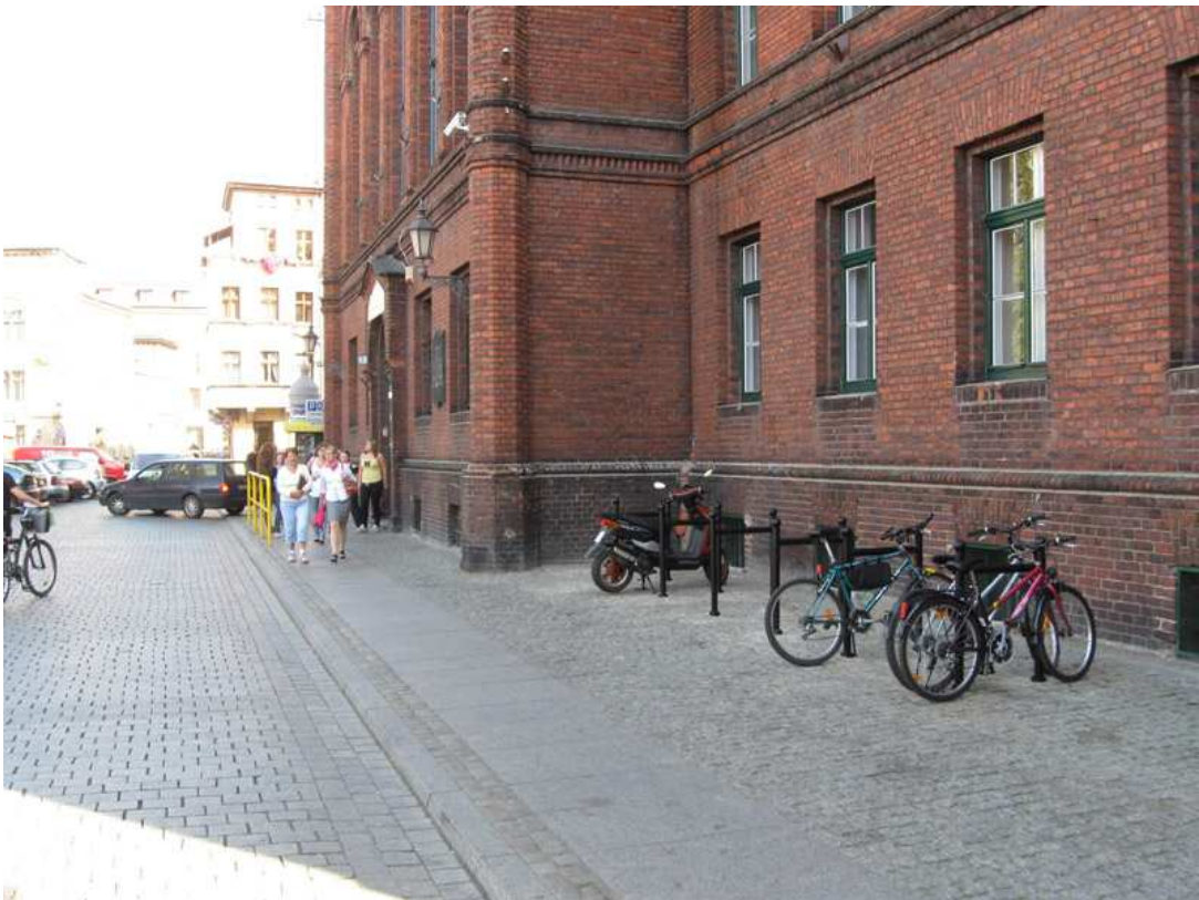
Stojaki rowerowe na terenie Starego Miasta – łączna ilość 35 sztuk.