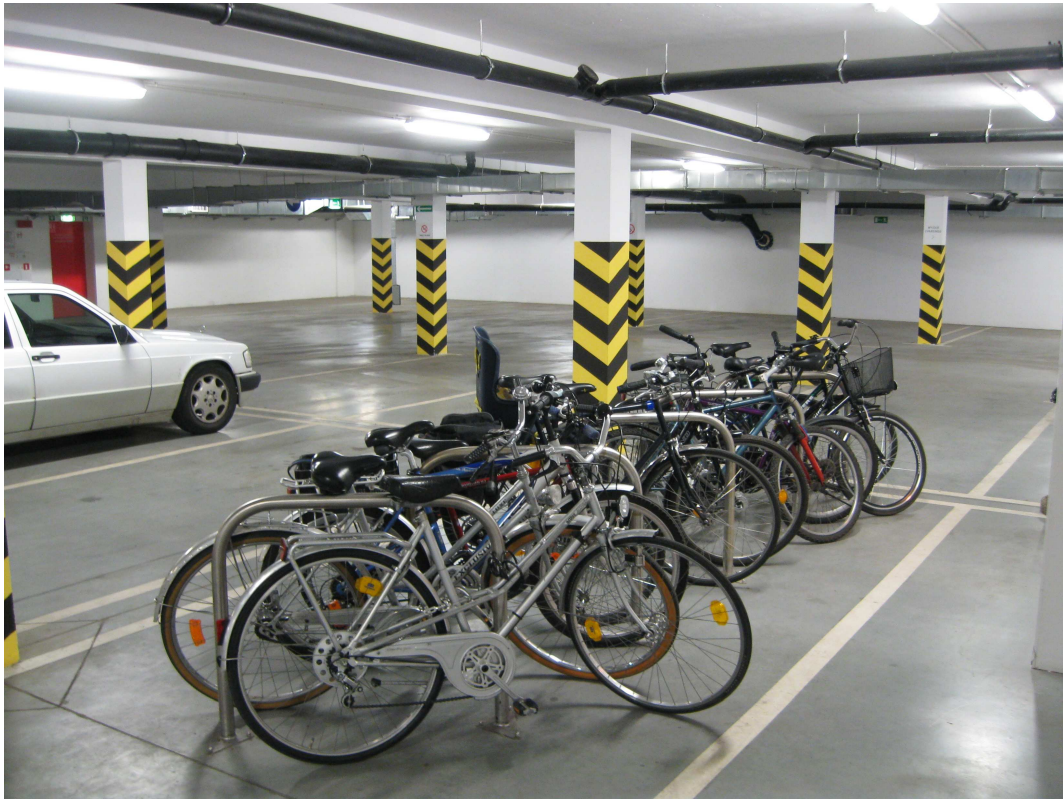
Centrum Sztuki Współczesnej w Toruniu – parking podziemny