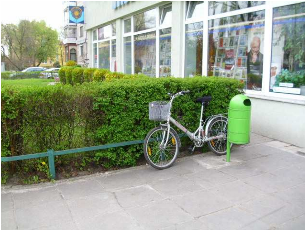
Dom Akademicki nr 12/Księgarnia Naukowa, ul. Reja 25 Stan obecny: brak stojaków rowerowych Zalecane: montaż 3 stojaków typu odwrócone U